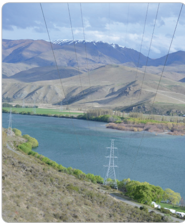
Obr. 1 Přenosové vedení společnosti Transpower, Benmore, Nový Zéland

Udržování záložních zdrojů energie je však velmi nákladné. Pro hospodárný provoz soustavy je nezbytné umět přesně vyčíslit minimální nutnou výkonovou zálohu, která zajistí spolehlivý chod sítě v rámci stanovené přijatelné míry rizika.